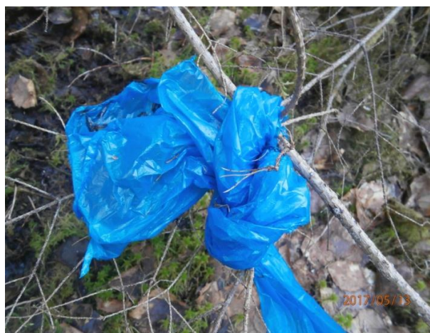
Рис. 9 Узел, завязанный С.Ч.

Дальше никаких меченых деревьев не было. С.Ч. сорвал ленты и унёс их. Нигде ничего не валялось. Видимо С.Ч. подумал, что я хочу завладеть его лесом, помечая деревья лентами, разграничивая свою территорию. Он сорвал ленты и сделал свою метку. Можно констатировать, что это тоже своего рода взаимодействие между мной и снежным человеком.