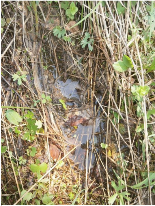
Рис. 6 След С.Ч. с перемычкой (Лен. обл.).