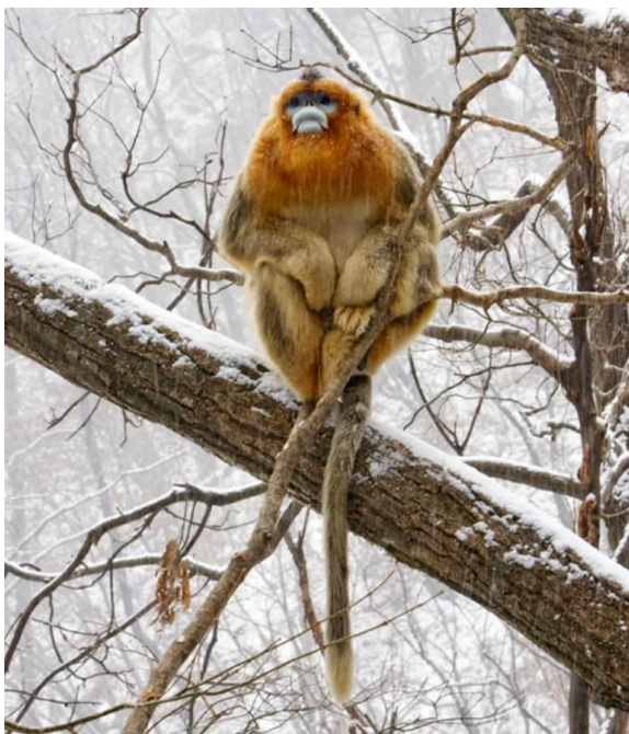
Рис. 1 Рокселланов ринопитек

сказать поселенцев первой волны, но уже через смены поколений, проплывавшие мимо этого острова люди, констатировали наличие на этом острове диких людей с обволосенным телом. Ну, так как это свидетельство относится к средним векам, доверять этому вопросу второй. Есть такая обезьяна в Китае – Rugatrix hoellana , рокселланов