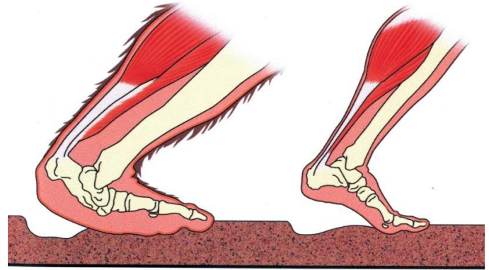
Рис. 7 Реконструкция постановки стопы по Д. Мелдруму

Я начал оставлять пищу для С.Ч.. Сначала вываливал макароны с килькой просто на брёвна, сухие продукты типа печенья в пакетах вешал на ветки. Пакеты потом были сняты, порваны и пустые валялись рядом. Макароны подъедены очень чисто, ничего не оставалось. Но это конечно могли быть и птицы. Потом я начал оставлять открытые консервы в банках. Зимой сойки могли поковыряться вс консервах, и это сразу было видно, потому что разбрызгано. Когда зимой приходил С.Ч. он вылизывал всё идеально, и ставил пустую банку на землю, всегда в одно и то же место, дном вниз. Целые батоны, насаженные на ветки снимал и видимо уносил, под деревьями ни крошки, птицы не смогли бы съесть батон за несколько ночных часов, тем более что ночью птицы спят. Несколько раз я слышал, когда приносил еду и звал определённым образом С.Ч., что кто-то большой ходил рядом и бормотал. Один раз даже издавал звук как цоканье языком. Я видел по телевизору, что так делала ручная горилла Коко. Получается, приманить едой С.Ч. можно и я считаю, что могу его (или их) привести в то место прикормки практически в любой месяц. Так, я думаю, С.Ч. ко мне привык. Он, конечно, видел меня не один раз, и скорее всего, узнаёт. Тем более я прихожу один, и С.Ч. чувствует свою безопасность.