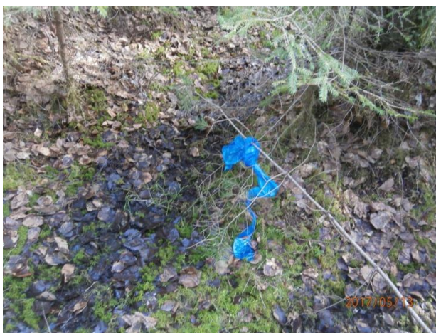
Рис. 8 Лента, повязанная на ветку.