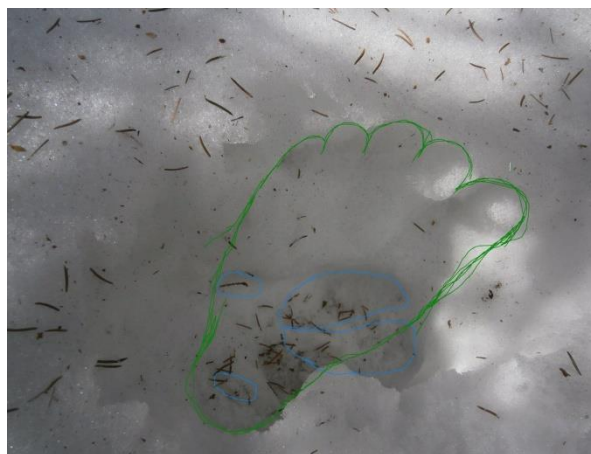
Рис. 3. прорисовка следа С.Ч.

Конечно, следов когтей как у медведя, и вообще когтей на следах С.Ч. быть не может, как, на этом следе (Рис. 2 и 3). Следы С.Ч. широкие, в целом человекоподобные. Выделяет их отличие – плоскостопие, не клиническое, а отсутствие подъёма стопы. Есть ещё указания на присутствие перемычки на следах примерно в середине отпечатка стопы. Это показывает американский антрополог и исследователь бигфута доктор Джеффри Мелдрум, на примере отпечатков следов и реконструкции постановки стопы бигфута (Рис. 4, 5 и 7).