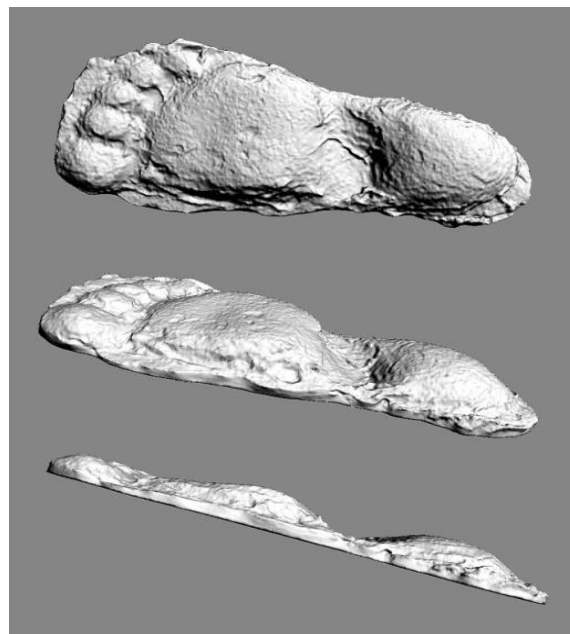
Рис.5. Слепок следа бигфута.

Я обнаружил такие следы в своём районе поисков. Сначала показалось, что это просто отпечаток ботинка. След находился на поле, влажном после только что сошедшего снега. В лесу было натуральное половодье. Думая, что это какой-то браконьер, я всё равно обследовал следы. Отодвинув все травинки, я понял, что это след стопы с пальцами. Не медвежий, потому что прошло двуногое существо, не, конечно же, человеческий (Рис. 6).