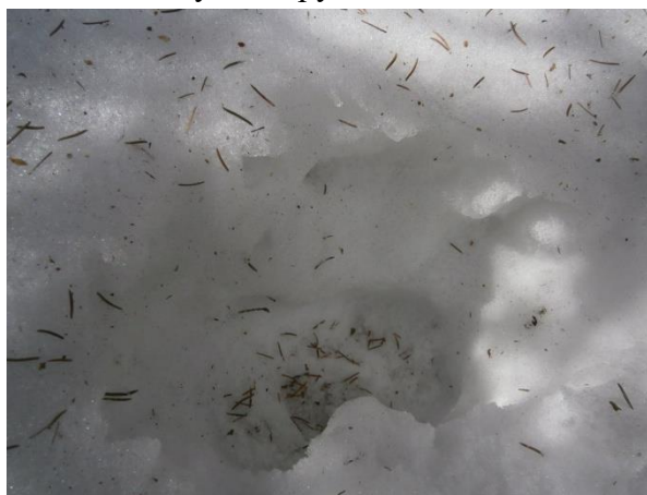
Рис. 1. След С.Ч. на следе копытного

Проще этого, конечно, обнаружить следы человекоподобных стоп С.Ч., как например эти следы на снегу, обнаруженные мной в Ленинградской области.